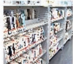
貸出可能な資料については、3階中央貸出カウンター前の書架にご用意しております。

なお、貸出可能なものは、同じ3階中央貸出カウンター前の書架にご用意しておりますので、こちらをご利用ください。