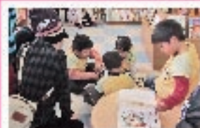
●PRポイント 絵本の読者が自立して、貸、借とも充実している