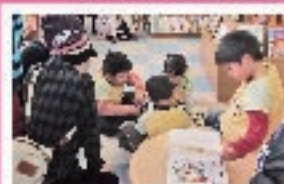
●PRポイント 絵本の読者が自立して、貸、借とも充実している