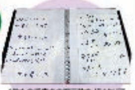
1枚もの手書きの掲示物などはクリアファイルに入れて、自由に閲覧いただけるようにしております。

東日本大震災をテーマとした様々な分野の資料を集めています。具体的には、販売されている図書・雑誌はもとより、宮城県や県内各自治体及び関係機関による当時の被災状況、各方面からの支援活動の様子がまとめられたもの、また、ライフラインをはじめとした、各分野で復旧・復興が進められていく過程がまとめられた行政資料も収集しています。その他、教育関係機関の資料集・広報紙・被災後に行われた学校行事関係の資料なども後世に伝えるべき資料として集めています。