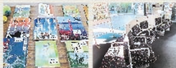
観光や産業などの各種情報誌も置いてあります。