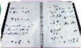
1枚もの手書きの掲示物などはクリアファイルに入れて、自由に閲覧いただけるようにしております。

東日本大震災をテーマとした様々な分野の資料を集めています。具体的には、販売されている図書・雑誌はもとより、宮城県や県内各自治体及び関係機関による当時の被災状況、各方面からの支援活動の様子がまとめられたもの、また、ライフラインをはじめとした、各分野で復旧・復興が進められていく過程がまとめられた行政資料も収集しています。その他、教育関係機関の資料集・広報紙・被災後に行われた学校行事関係の資料なども後世に伝えるべき資料として集めています。