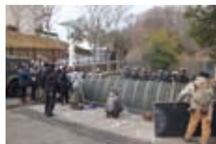
良化隊の侵入を防ぐため、銃撃で応戦するシーンを撮影