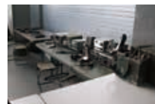
図書隊の本部が設置されていたところ