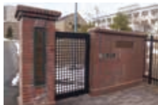
門に「水戸図書基地隊舎」の看板を設置