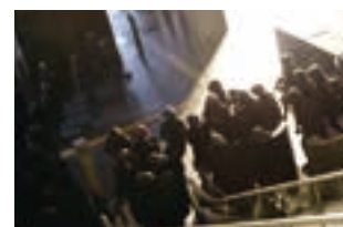
良化隊が2階に侵攻していくシーンを撮影