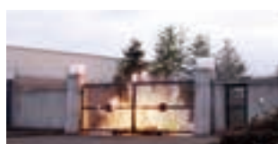
水戸図書館の裏門を設置し、門を爆破するシーンを撮影