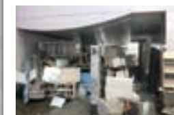
3階階段付近に設置されたバリケード