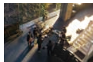
カミツレの鉢が置かれていたところ