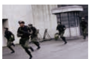
守衛所を撮影のために設置