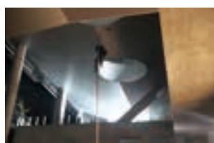
笠原らがリペリングで降りたシーンを撮影