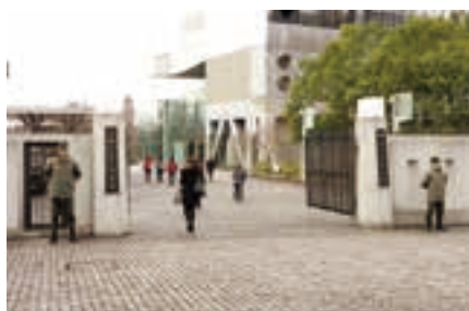
正面広場に水戸図書館の看板・正門を設置