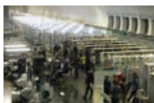
3階開架フロアでは壮絶な銃撃戦のシーンを撮影