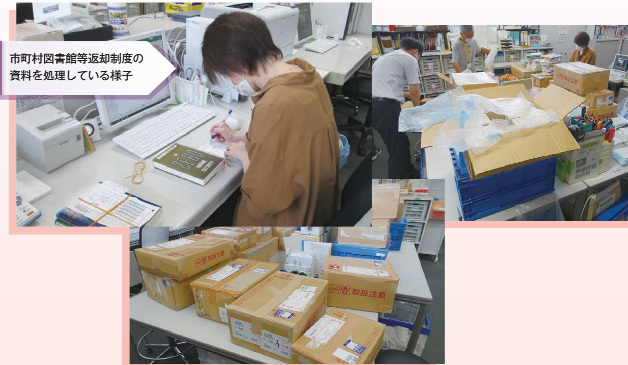
市町村図書館等返却制度の資料を処理している様子

第67号 2020年10月発行 編集・発行 宮城県図書館 〒981-3205 仙台市泉区紫山一丁目1番地1 TEL022-377-8441(代表) FAX022-377-8484 ホームページ https://www.library.pref.miyagi.jp/